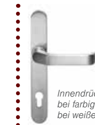
Innendrücker Langschild, bei farbigen Türen in EV1, bei weißen Türen in weiß

Für Haustüren und Seitenteile der Serie CONCEPT CLASS wird 3-fach-Glas mit Verbundsicherheitsglas (VSG) außen verwendet. U_g -Wert: 0,7 \text{ W/m}^2\text{K}