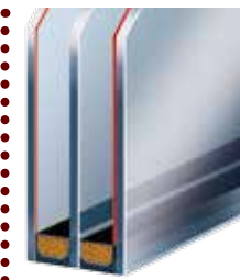
3-fach Verglasung mit thermisch optimiertem Randverbund (Warme Kante)

Für Haustüren und Seitenteile der Serie CONCEPT CLASS wird 3-fach-Glas mit Verbundsicherheitsglas (VSG) außen verwendet. U_g -Wert: 0,7 \text{ W/m}^2\text{K}