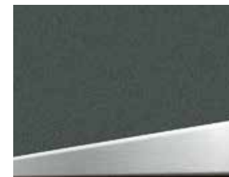
Trittschutz in Edelstahloptik, flächenbündig in die Türfüllung eingelassen