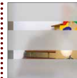
Sandstrahlmotiv mit klaren Streifen

Die Gläser der Serie CONCEPT CLASS wurden harmonisch auf das Design der Haustüren abgestimmt. Sie erhalten alle Haustüren preisgleich mit Ornamentglas Satinato oder mit dem Sandstrahlmotiv (Kombination aus Ornamentglas Satinato und senkrechtem Klarglas-Streifen). Für die Seitenteile empfehlen wir, wie oben abgebildet, die jeweils zur Haustür passende Modellverglasung mit Sandstrahlmotiv. Auf Wunsch liefern wir die Seitenteile preisgleich auch mit Ornamentglas Satinato.